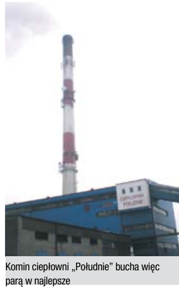
Komin ciepłowni „Południe” bucha więc parą w najlepsze

Tymczasem średnia dobową temperaturę pierwszych 13. dni lutego ukształtowała się na poziomie minus 14,5 stopnia Celsjusza. Towarzyszyło jej, rzecz jasna, korzystne dla spółki znaczne zwiększenie sprzedaży ciepła. Tylko 3 i 4 lutego średniobodowa temperatura obniżyła się