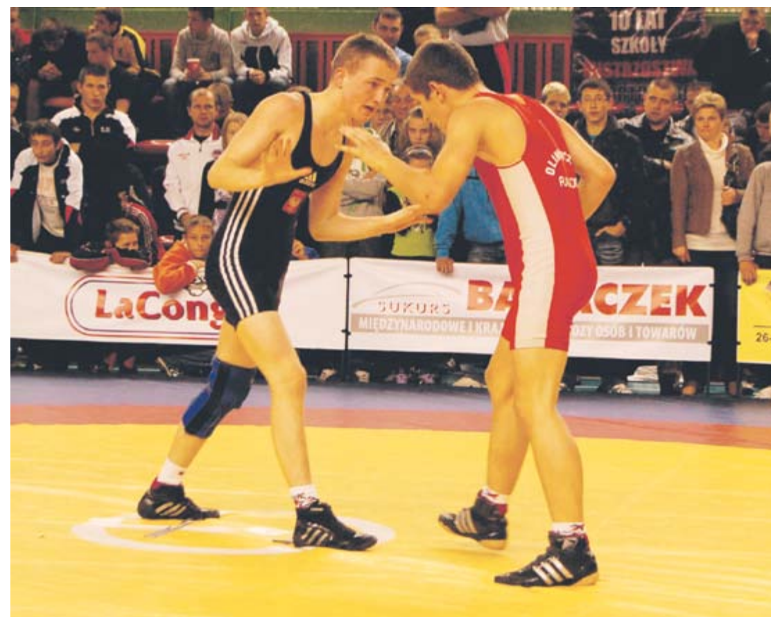
Zapaśnicze środowisko jest jednym z najprężniej działających w Radomiu

Fedorowicz. Ogromny potencjał, ale raczej nie na poziomie olimpijskim,