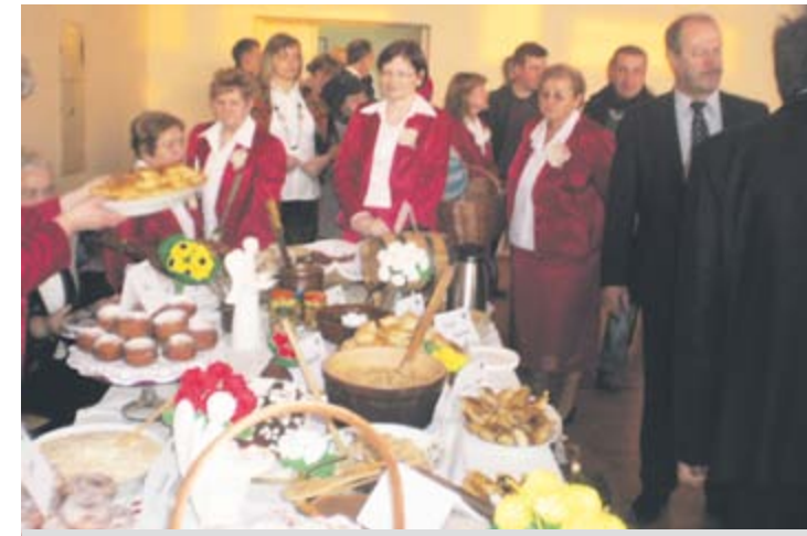
Stół „Półborzanki” z Augustowa (gmina Pionki) przyciągał wzrok bogactwem i zapachem potraw oraz gustownymi ubiorami pań.