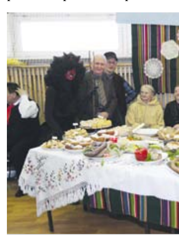
„Strykowiacy” (gmina Zwolen) wyróżniali się kompozycją stoiska oraz oryginalnymi ubiorami zapustowych kusaków.

nych, wyróżnienie potraktują jako otwarcie nowego rozdziału w ich urozmaiconej działalności artystycznej.