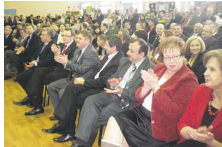
Goście i uczestnicy imprezy żywo reagowali na popisy zespołów z poszczególnych gmin