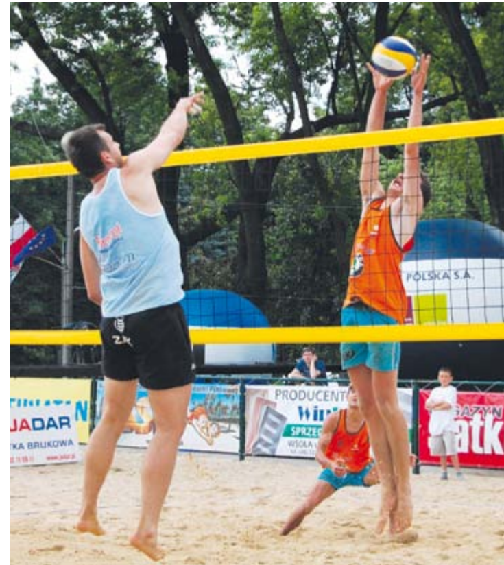
Siatkówka - zarówno w halowym, jak i plażowym wydaniu - jest jedną z wizytówek naszego regionu

tkwi także w siatkarskich - Radom reprezentantów Polski ma zarówno w halowej, jak plażowej odmianie - zawodników sportów motorowych, bokserach a także