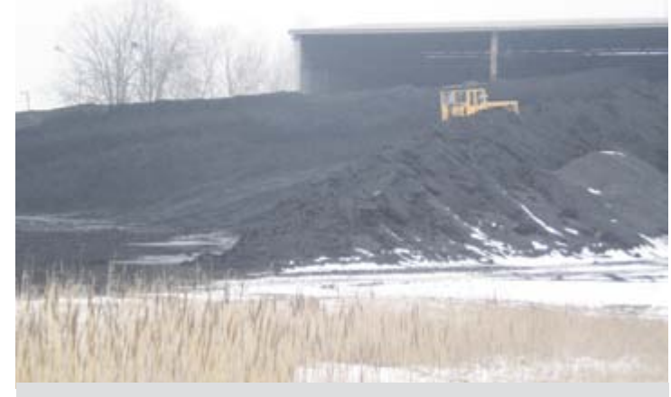
W lutym zużycie węgla podwoiło się, lecz widać, że go nie zabraknie

- Występowały dni, w których średniobodowa temperatura w Radomiu zbliżała się do -20 stopni Celsjusza, czyli do granicy, którą uwzględnia się przy projektowaniu urządzeń grzewczych w naszej strefie klimatycznej. Zużywaliśmy w nie dwukrotnie więcej opału niż na przykład w grudniu. W ciepłowniach „Południe” i „Północ” 10 kotłów wytwarzało non stop ciepło. W rezerwie po-