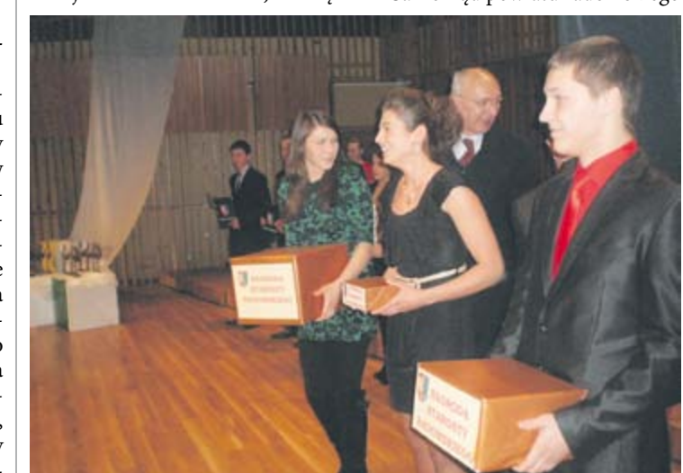
Laureaci kategorii wiekowej 1996 i młodszy otrzymali nagrody ufundowane przez Starostwo Radomskie