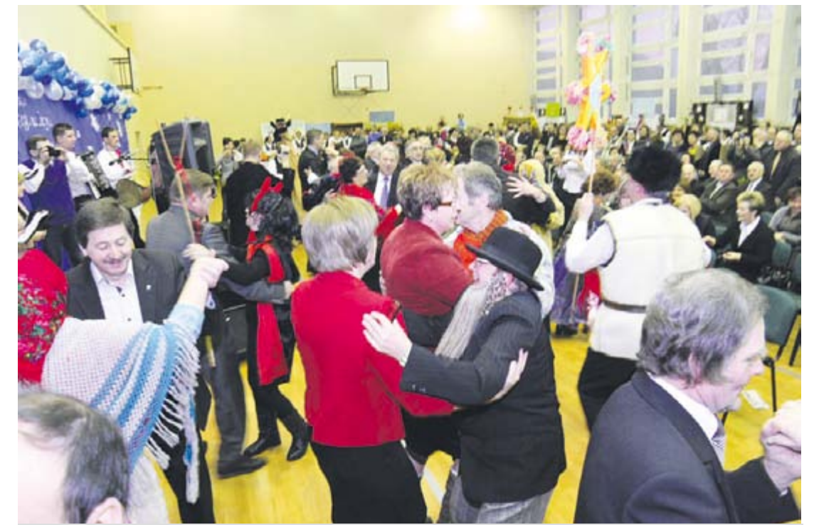
Festiwal w Zwoleniu zakończył się fajną zabawą. Najpierw przebierańcy poprosili do tanecznych wygibusów gości i organizatorów karnawałowej imprezy w stylu retro. Trafili w ich oczekiwania. Prawie do północy trwały popisy par i samowarzących wodzirejów przetrzonych koleżek i tanecznych korowodów. Ustaly gdy nawet najwytrwalsi, umęczeni walczkami, kujawiakami i obertasami popadali ze zmęczenia, a sprzątaczkę dały swoją obecnością do zrozumienia, że czas wrócić do swoich gmin i domów.