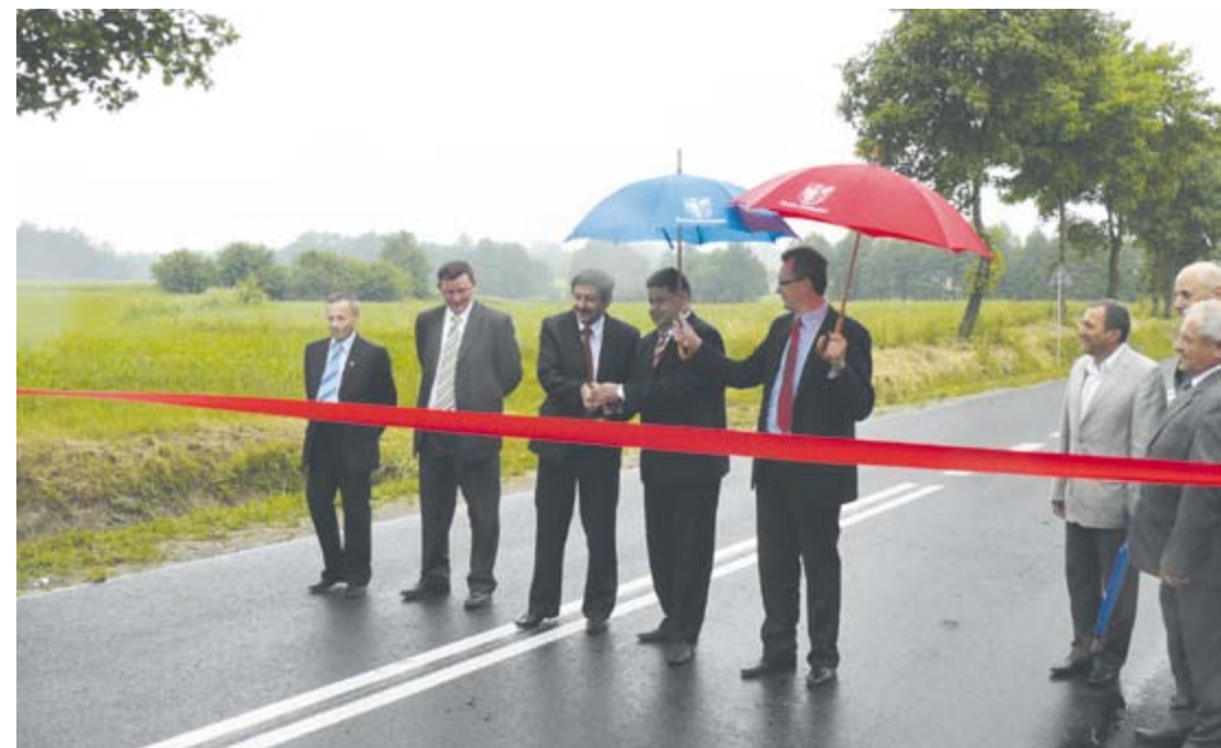
Otwarcia przebudowanej drogi powiatowej Zwoleń-Baryczka dokonują wicewojewoda Dariusz Piątek i starosta Waldemar Urbański.

Zarząd Powiatu w Zwoleniu ma pod swoją pieczę 239 km dróg. W 2011 roku przebudowano 15,7 km dróg powiatowych i 257 mb chodników. Wartość wykonanych robót wyniosła 4,6 mln zł, z czego nieco ponad 3 mln zł stanowią środki zewnętrzne, głównie czerpane z budżetu wojewody mazowieckiego (2,7 mln zł), funduszy unijnych (209 tys. zł) oraz Urzędu Marszałkowskiego i gmin.